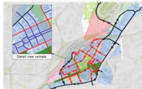
Pla de Mobilitat de Montmeló, 2011