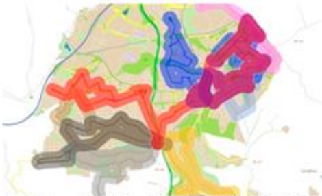
Model de previsió de trànsit de Sant Cugat del Vallès, 2010