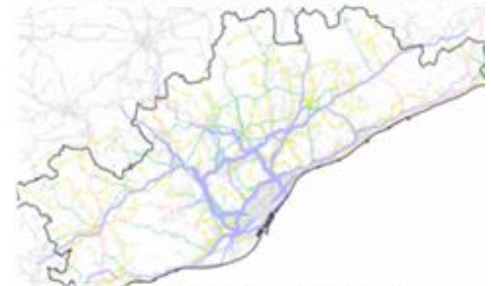
Pla Director de Mobilitat de l'RMB, 2007