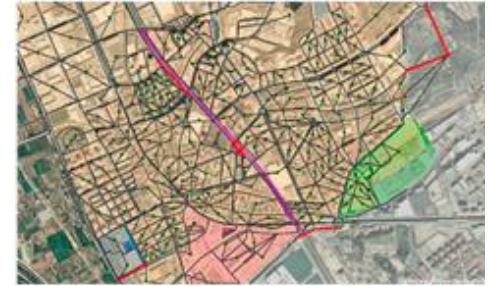
Model de previsió de Sant Feliu del Llobregat, 2010