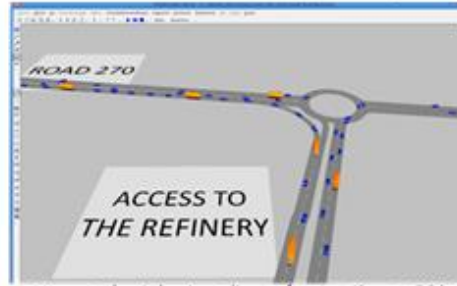
Microsimulació de trànsit d'una refineria a Kuwait, 2014