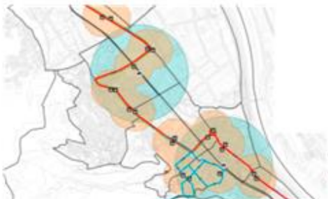
EAMG del POUM de Sant Andreu de la Barca, 2011