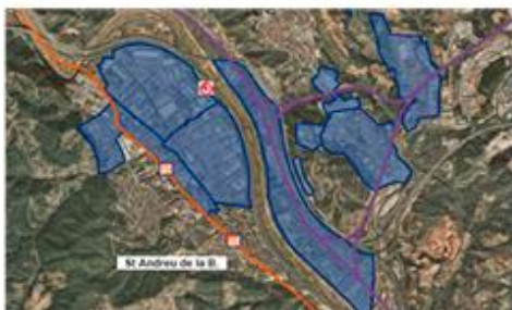
Estratègies de mobilitat als polígons industrials de l'RMB, 2012