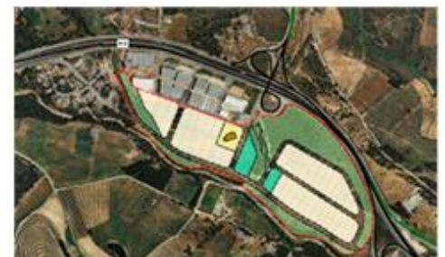
EAMG del Polígon Industrial Ginesteres de Collbató (2011)