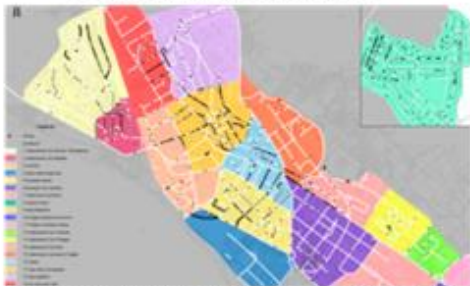
Pla de Mobilitat urbana de Santa Coloma de Farners, 2013