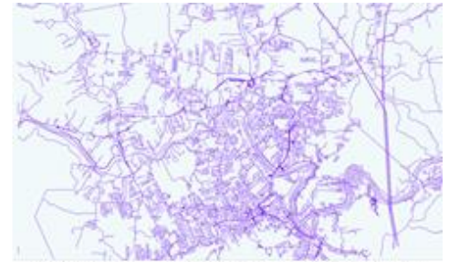
Pla de mobilitat urbana de Blumenau, Brasil, 2017