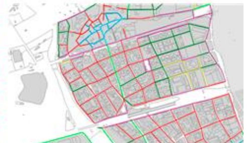
EAMG del POUM de Manresa, 2013