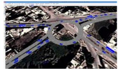
Microsimulació de trànsit a Bizerte (Tunisia), 2014