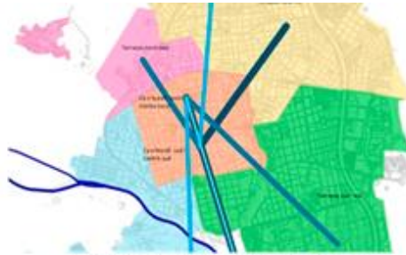
Pla de Mobilitat urbana de Terrassa, 2014