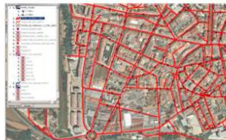
EAMG del POUM de Manresa, 2013