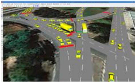
Microsimulació de trànsit a l'accés de Can Feu(Sabadell),2014