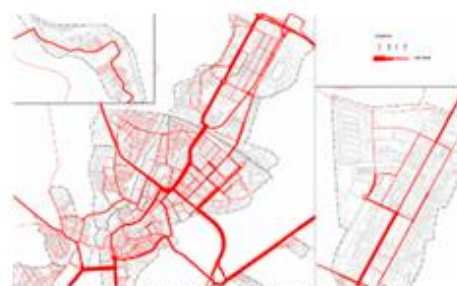
Model de previsió de trànsit de Valls, 2014